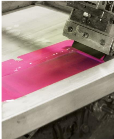
Reinigungslösungsmittel für sämtliche Tinten und Lacke, auf Lösemittel- oder Pflanzenbasis

iBiotec® Tec Industries®Service Z.I La Massane - 13210 Saint-Rémy de Provence – France Tél. +33(0)4 90 92 74 70 – Fax. +33 (0)4 90 92 32 32 www.ibiotec.fr